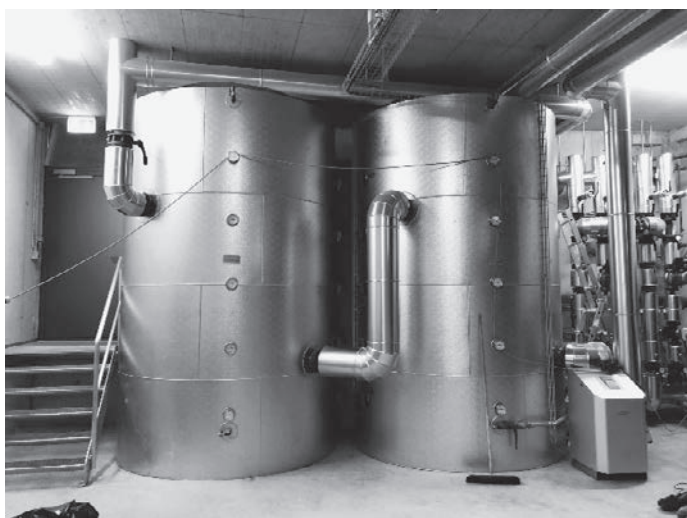
Warmwasserspeicher 2 × 9600 Liter

Wie in der letzten Info angekündigt, konnte der Wärmeverbund Anfang November 2020 ihre angeschlossenen Kunden mit Wärme versorgen. Kurz vor Weihnachten war es dann soweit, der Holz hackschnitzelofen der Firma Schmid AG konnte fertig in Betrieb genommen werden.