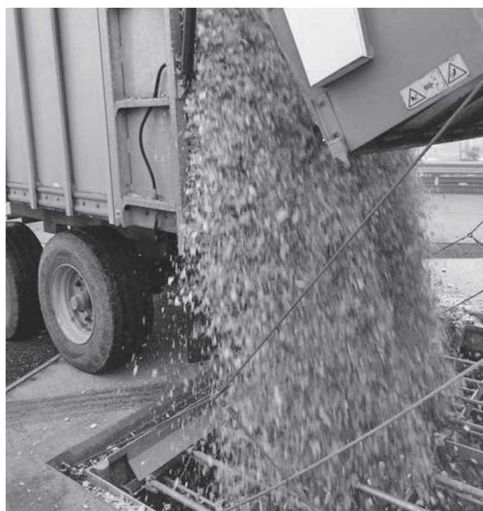
Erste Holzlieferung 16. Dezember 2020

Nun werden unsere Kunden mit erneuerbarer Energie versorgt. Ein gutes Gefühl für uns als Betreiber des Wärmeverbunds. Mit Sicherheit auch ein gutes Gefühl für unsere Kunden, welche einen Energieträger nutzen, der zum grössten Teil aus unserer Gemeinde stammt. Mit der abgegebenen Energie des Wärmeverbunds konnte bis Ende Januar 2021 ca. 25t CO 2 eingespart werden, verglichen mit dem Betrieb mit Oel-Heizungen. Ein wertvoller Beitrag unserer Kunden zur Energiewende hin zu mehr erneuerbarer Energie. Aktuell sind alle Gemeindeliegenschaften und ein paar private Liegenschaftsbesitzer angeschlossen.